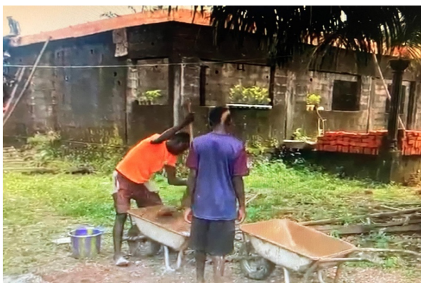
Bouwvakkers aan het werk