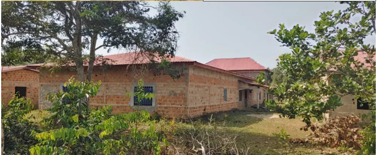
Achterkant van het ziekenhuis/ achterin zie je de opbouw van de hoofdingang (rechts verpleeggebouw)

Geweldig. De verpleeggebouwen worden op dit moment met hulp van de Guinese overheid en bouwers helemaal compleet afgebouwd.