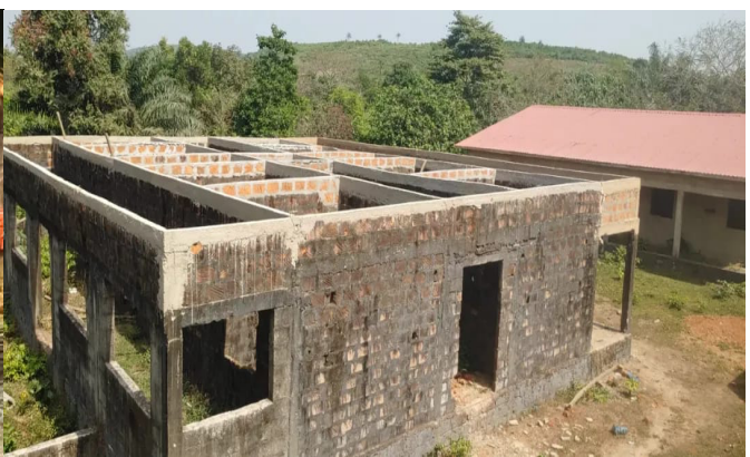
Bij de 2 verpleeggebouwen, waar nog geen dak op lag, moesten een paar rijen stenen opnieuw worden opgemetseld.